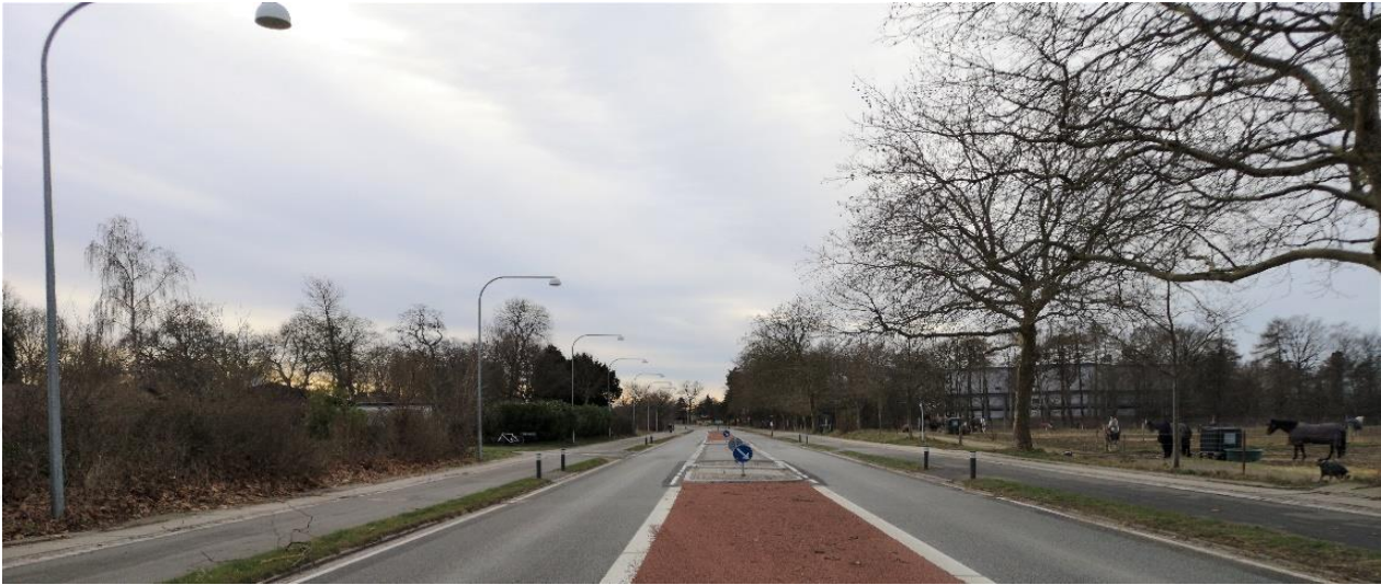
Hjortekærvej - fartdæmpning ved etablering af midterheller