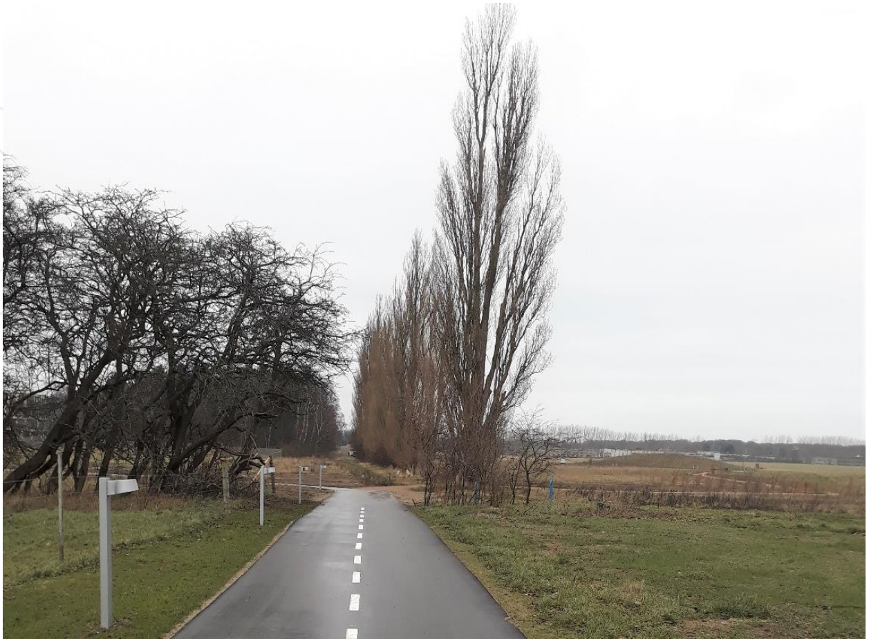
Ny cykel- og gangsti fra Trongårdsstien til Novozymes - Rævehøjvej (set mod nord)

Der er anlagt sti fra Trongårdsvej til stisystemet på Dyrehavegårds Jorde på hver side af Novozymes. Stierne forbinder Rævehøjvej med Trongårdsvej.