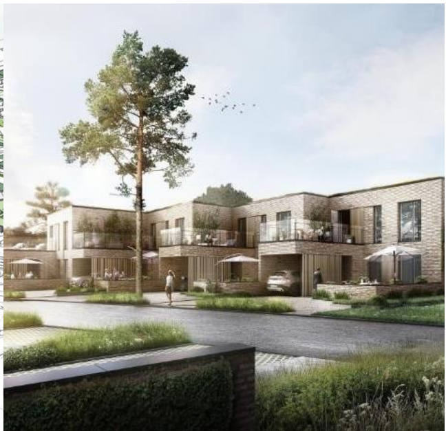
Skitse og visualisering af det kommende rækkehuskvarter Trongården