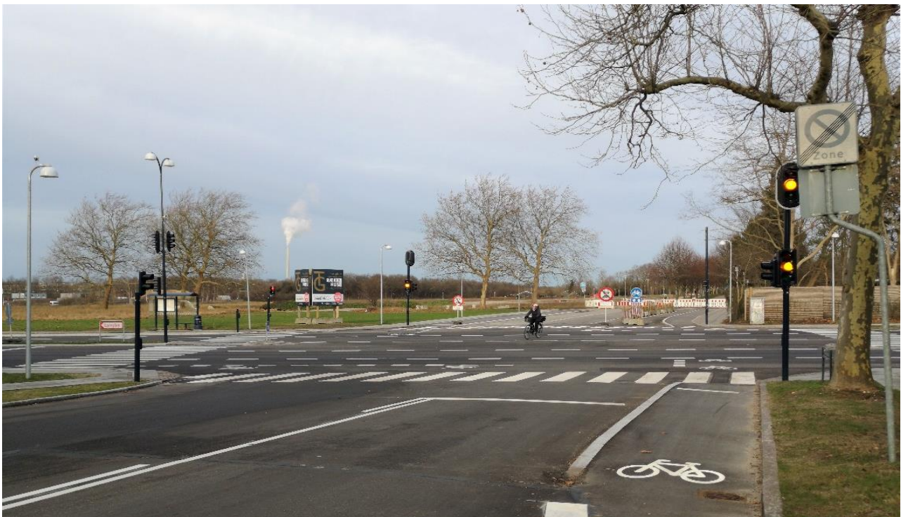
Ny signalregulering ved Trongårdsparken – Klampenborgvej - Hvidegårdsparken

Krydset Klampenborgvej/Hvidegårdsparken er i foråret 2018 blevet ombygget med signalanlæg, og de første 50 m af Trongårdsparken er anlagt. Krydset skal fremover være adgangsvej til Trongårdens Byområde. Det nye vejstykke af Trongårdsparken skal i første omgang benyttes som byggepladsvej til Trongårdens Byområde og vil således ikke være åben for almindelig trafik. For at sikre skoletrafikken er der etableret midlertidig dobbeltrettet sti, som er adskilt fra byggeplads trafikken med betonklodser og skiltning.