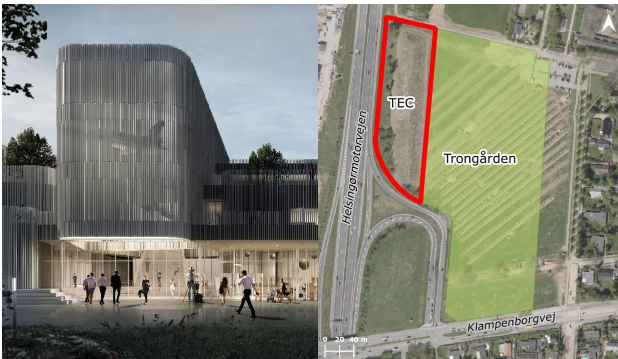
Visualisering af hovedindgangen til H.C. Ørsted Gymnasiet og kort over området

Byggeriet forventes at gå i gang i februar 2019, så gymnasiet kan stå færdigt i august 2020. Første spadestik tages den 27. februar kl. 13, hvor alle interesserede er velkomne. Når byggeriet går i gang, kan borgere og interesserede henvende sig med spørgsmål o.a. til TECs bygningsafdeling på tlf. 3817 7000.