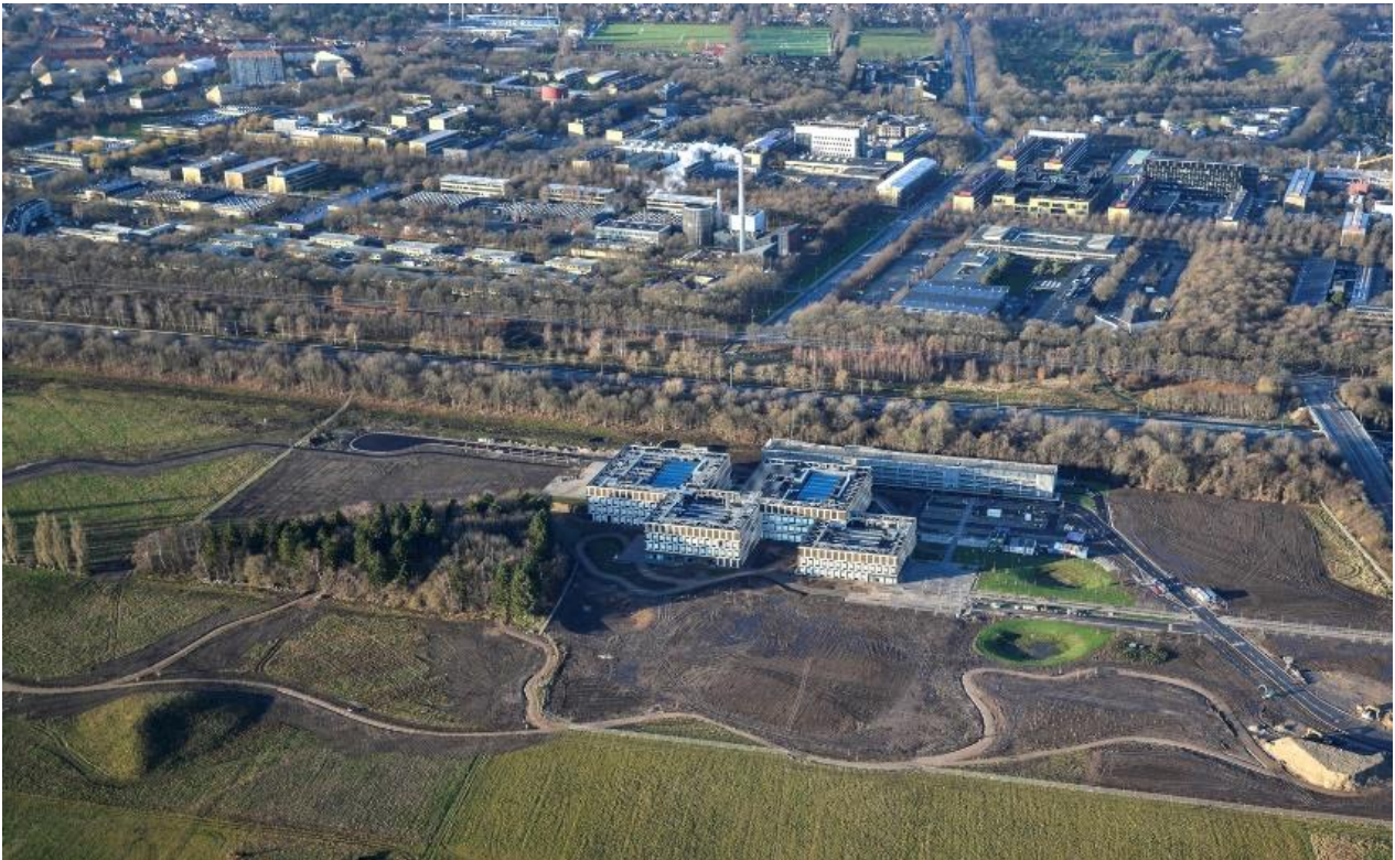
Luftfoto af Novozymes Innovation Campus

Som det fremgår af luftfotoet, er de fleste arealer rundt om Campus blevet plantet til og mange flere træer og buske er på vej. Novozymes skal desuden anlægge en række aktiviteter langs naturstien. Valget af aktiviteter planlægges lige nu i et samarbejde mellem kommunen og Novozymes med udgangspunkt i input fra borgerne og virksomhedens ledelse og medarbejdere. Det skal sikre, at aktiviteterne vil blive brugt og afspejler et behov i nærområdet.