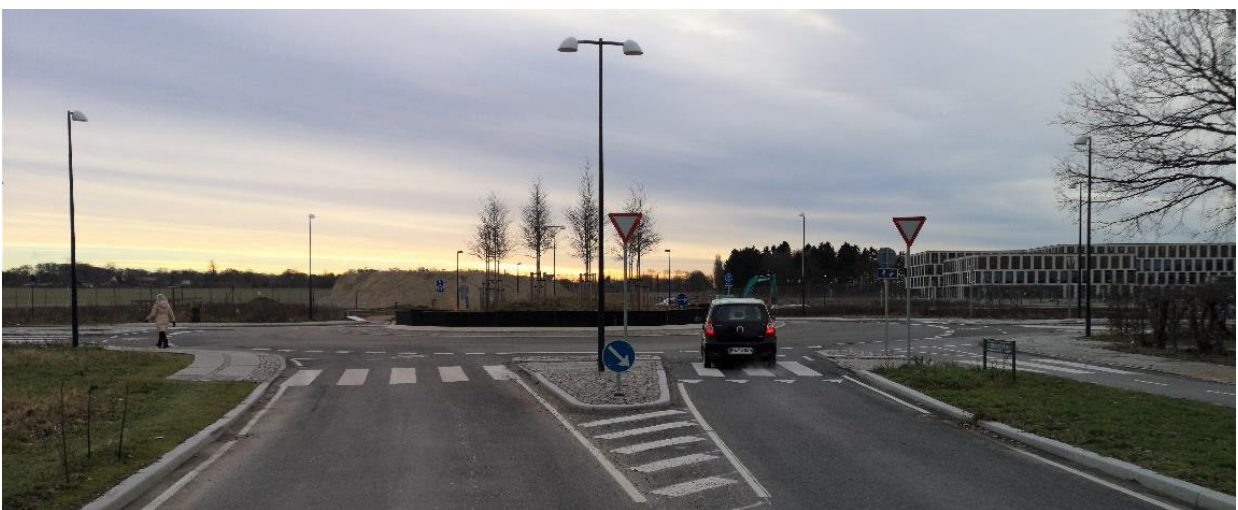
Ny rundkørsel ved Rævehøjvej (set mod syd)

Der er anlagt sti fra Trongårdsvej til stisystemet på Dyrehavegårds Jorde på hver side af Novozymes. Stierne forbinder Rævehøjvej med Trongårdsvej.