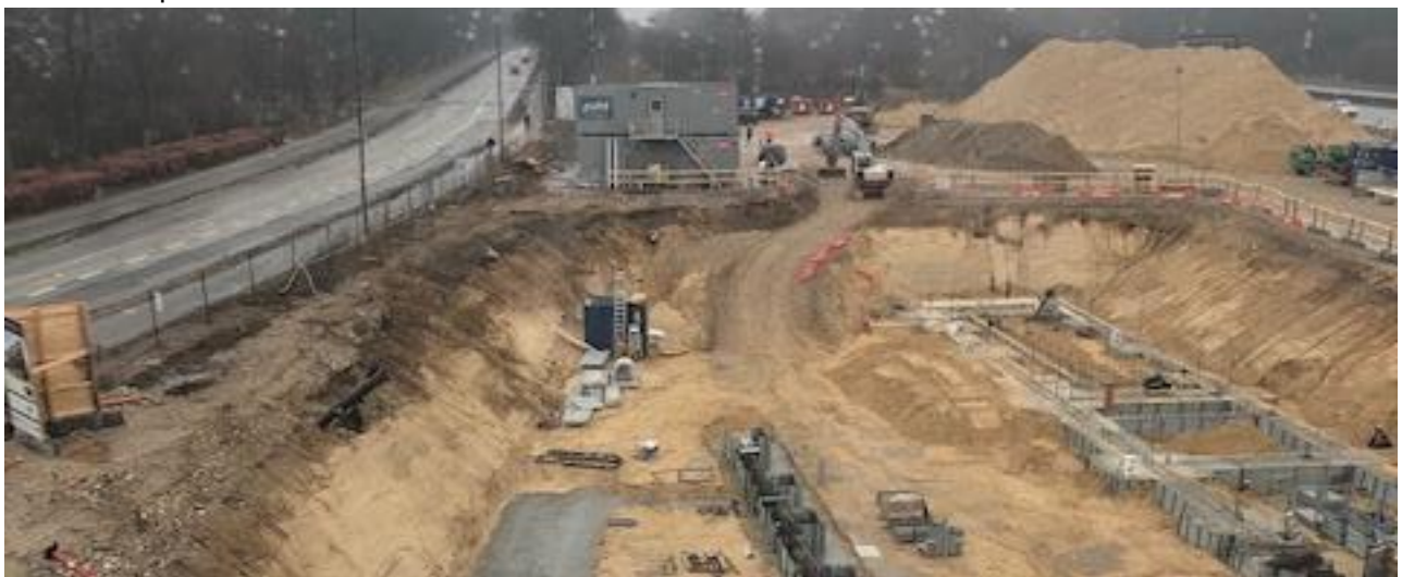
Hotelbyggeriet nord for bilhuset med Lundtoftegårdsvej til venstre - 2. februar 2019

Nord for bilhuset er Benjamin Capital ved at opføre et hotel. Byggeriet gik i gang før jul og forventes afsluttet medio 2020 med Zleep og Fitness World som lejere. Hotelbyggeriet er omfattet af lokalplan 265.