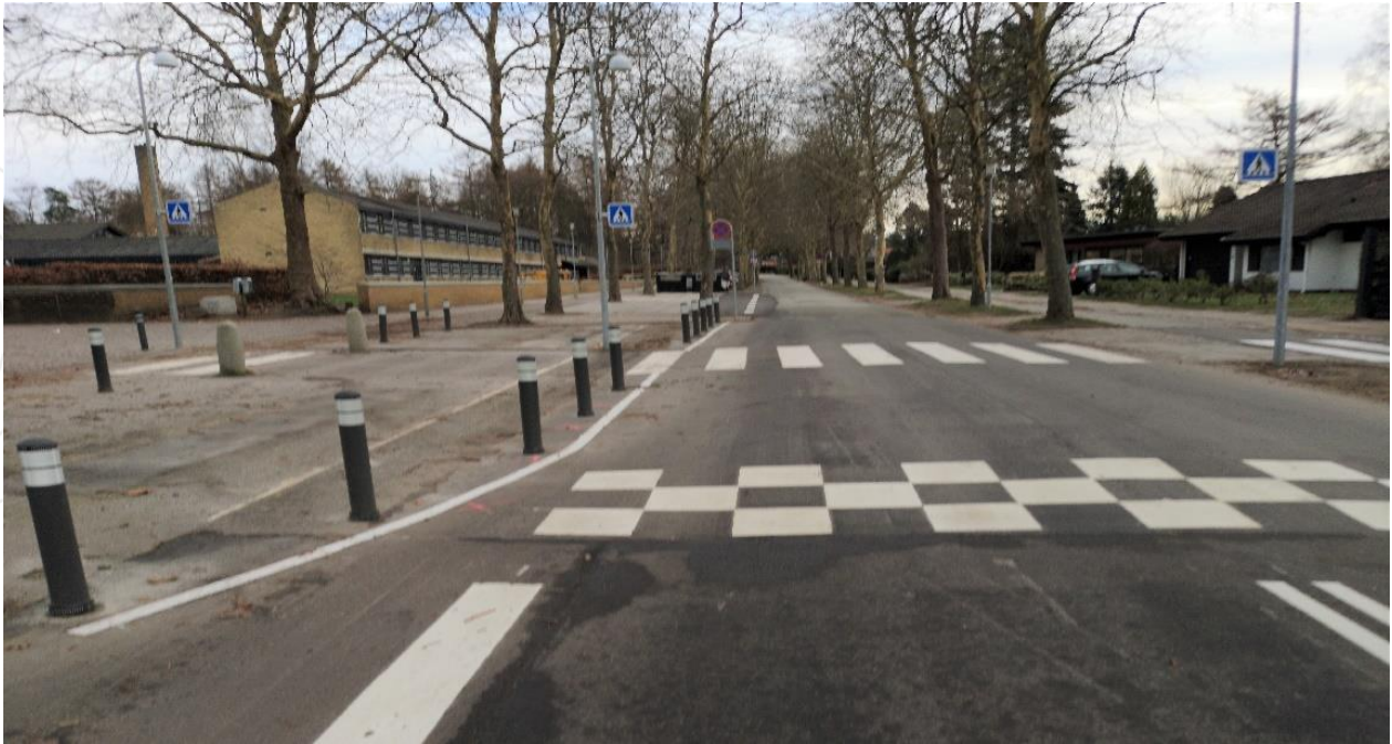
Trafikdæmpning på Trongårdsvej

Trongårdsvej er i sommeren/efteråret 2018 blevet fartdæmpet til 40 km/t med hævede flader og mini-rundkørsel i den vestlige ende af vejen. Trongårdsparken ombygges af hensyn til, at det er skolevej og for at undgå gennemkørende trafik, når Trongårdsparken åbner op mod Klampenborgvej.