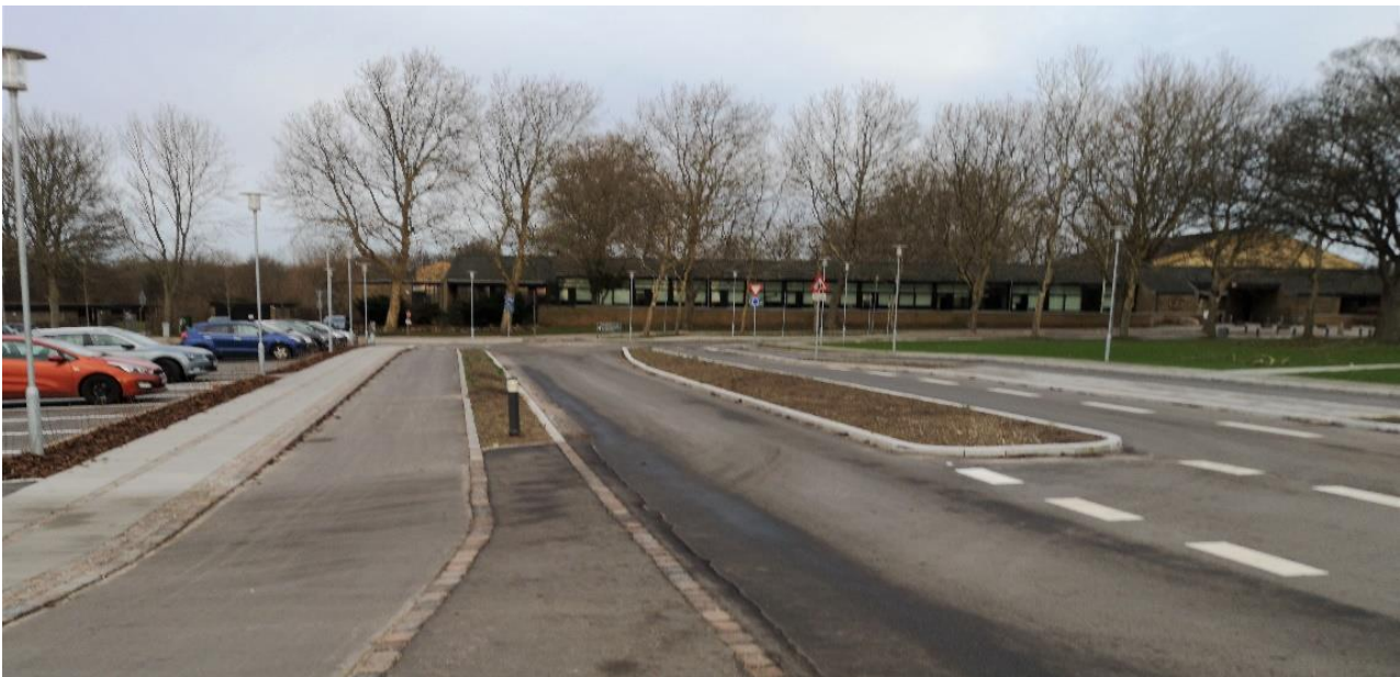
Minirundkørsel og p-plads ved Trongårdsparken - Trongårdsvej

Trongårdsvej er i sommeren/efteråret 2018 blevet fartdæmpet til 40 km/t med hævede flader og mini-rundkørsel i den vestlige ende af vejen. Trongårdsparken ombygges af hensyn til, at det er skolevej og for at undgå gennemkørende trafik, når Trongårdsparken åbner op mod Klampenborgvej.