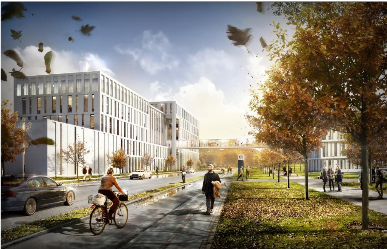
Visualisering af Hempel forbundet med gangbro på tværs af Lundtoftegårdsvej

Hempel vil løbende sende information ud, når de forventer, at der vil være øget larm, trafik eller andre aktiviteter, som vil kunne opleves som gener. Interesserede kan tilmelde sig nyhedsbrevet på communications@hempel.com med overskriften "byggeri" i emnefeltet.