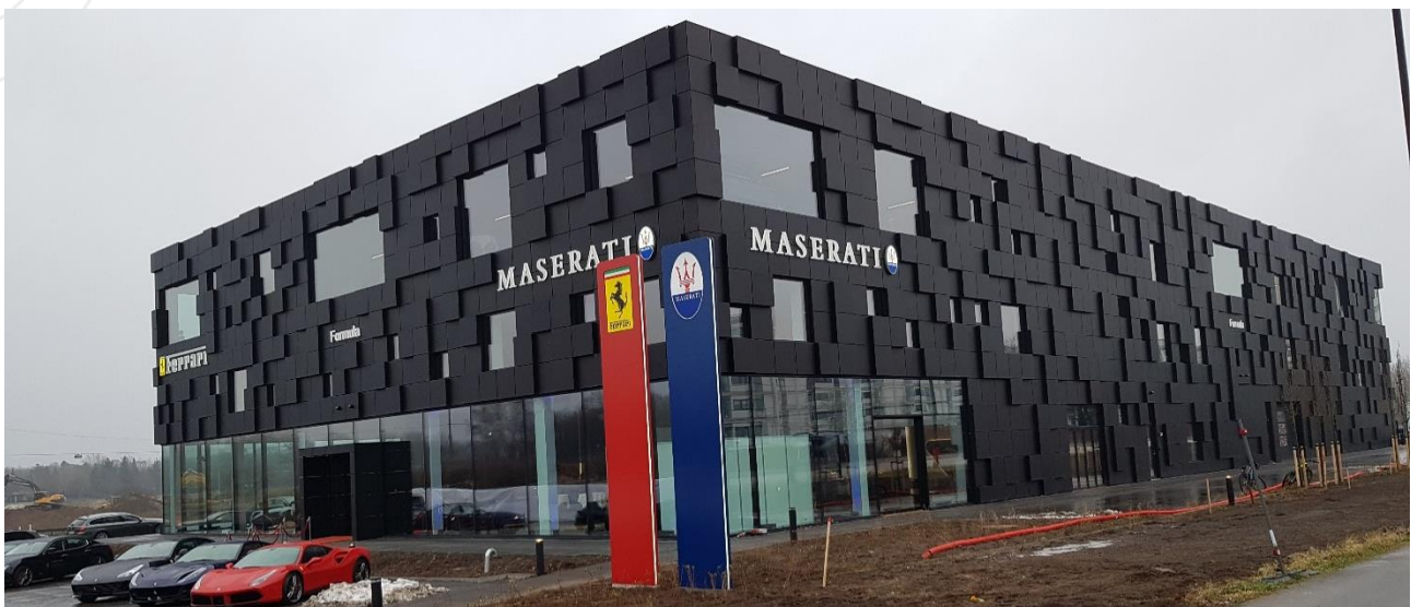
Indvielse af bilhuset 2. februar 2019 – set fra Lundtoftegårdsvej

Formula Automobile har færdiggjort deres nye hovedsæde for Ferrari og Maserati i den sydlige ende af Lundtoftegårdsvej. Det nye bilhus er blevet indviet med forskellige arrangementer. Området omkring bilhuset vil blive beplantet i løbet af foråret.