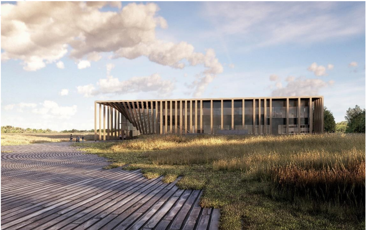
Visualisering af LIFE

2021 forår LIFE-bygningen er klar til de første besøg fra skoler.