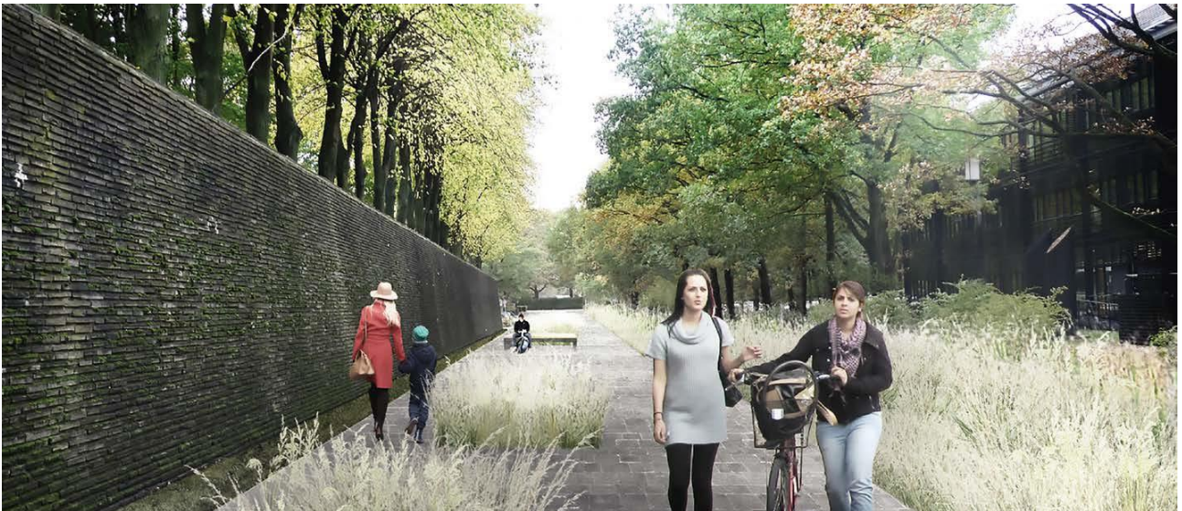
Visualisering af øst- vestgående på tværstrøg på DTU med landskabstræk

Den overordnede udviklingsplan for Tracéet indbefatter bygninger med grønne områder og træer imellem. Nye serviceveje bag om byggerierne skal give let adgang til parkering, varelevering, renovation, brand- og redningskøretøjer o. lign. En ny servicevej til Tracéet planlægges af få ind- og udkørsel lige over for Akademivej. I øjeblikket arbejder DTU, i samarbejde med ledningsejere, Lyngby-Taarbæk Kommune og øvrige interessenter, på etablering af dele af infrastrukturen i form af veje, ledningsomlægninger og vandafledning, så DTU er klar til kommende nye byggerier.